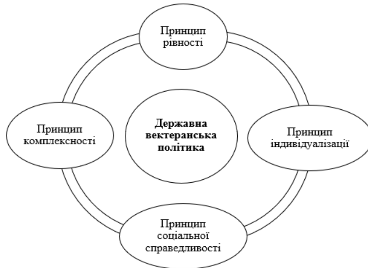
Рисунок 1 – Принципи державної ветеранської політики в Україні