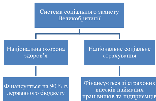
Рис. 2. Структура фінансування соціального забезпечення у Великобританії

У Великобританії відсутні спеціально організовані інститути, які страхують різноманітні соціальні ризики, натомість всі можливі програми об'єднані в єдину систему соціального захисту. Фінансування соціального забезпечення у Великобританії (рис. 2) [1]: