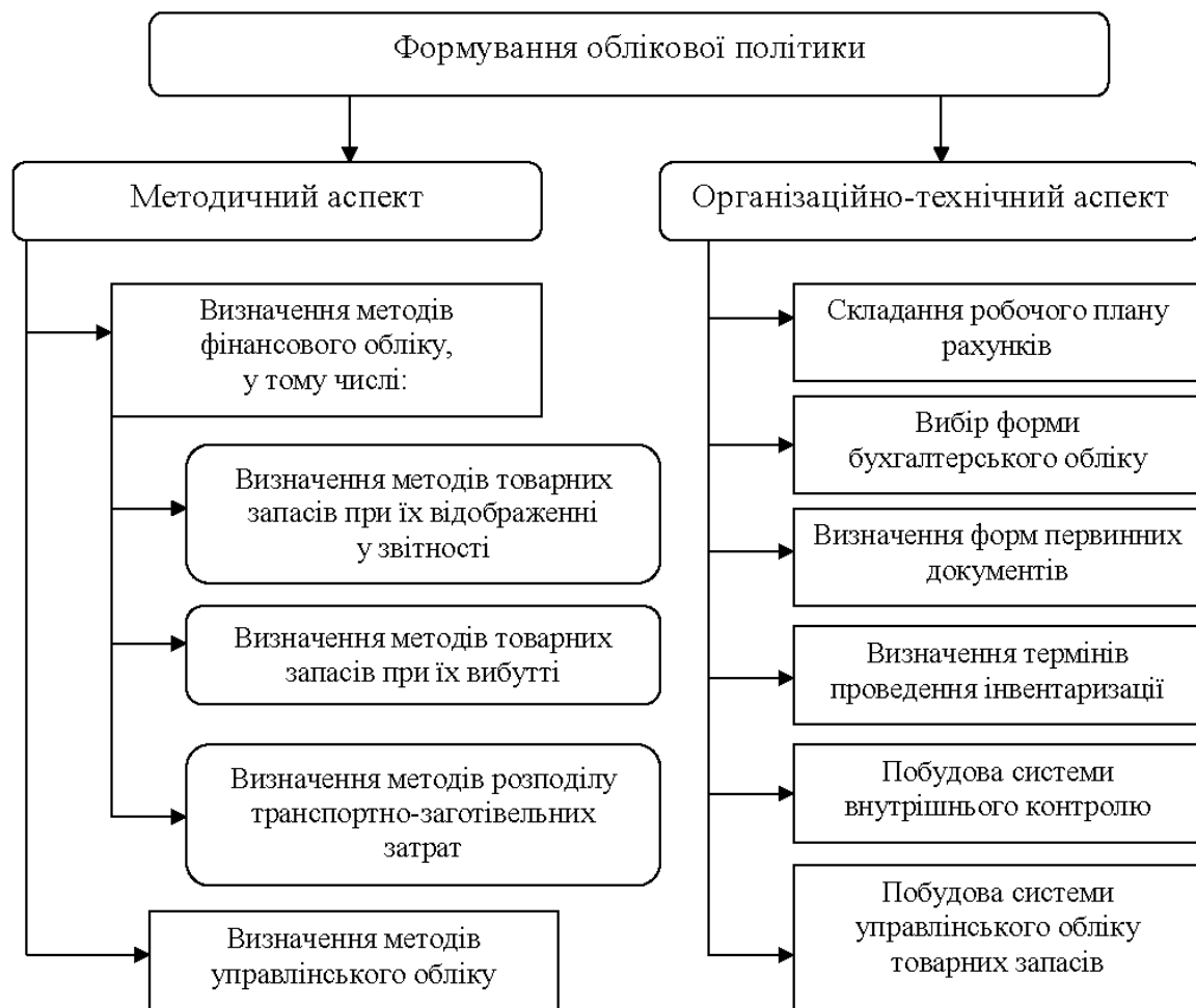
Рис. 2. Формування облікової політики з урахуванням важливості товарних запасів

– опис відхилень від загальних правил. Основні положення облікової політики визначають лише відступи від загальноприйнятих правил. Таким чином, в обліковій політиці відображаються основні положення ведення обліку з урахуванням галузевих специфік ведення господарства. За відсутності галузевих інструкцій правильний вибір облікової політики, дотримання всіх правил її оформлення мають першочергове значення.