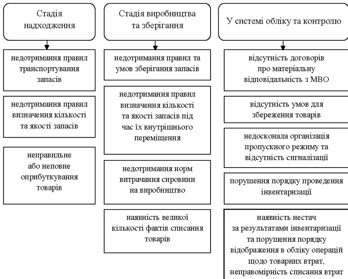
Рис. 3. Типові порушення щодо запасів на різних стадіях руху товарів

Існує перелік типових порушень на різних стадіях товароруку та в частині облікового відображення операцій із товарними запасами та їх утратами (рис. 3).