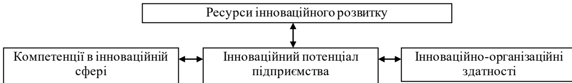
Рис. 2. Складові інноваційного потенціалу промислового підприємства

При цьому частина функцій у сфері оперативного та стратегічного менеджменту інновацій на підприємстві, прийняття рішень щодо інноваційних проектів, буде покладена на новий структурний підрозділ, якому будуть підконтрольні інші з метою раціоналізації інноваційних процесів. Функціональні обов'язки даної організаційної підструктури підприємства зображені на рис. 3.