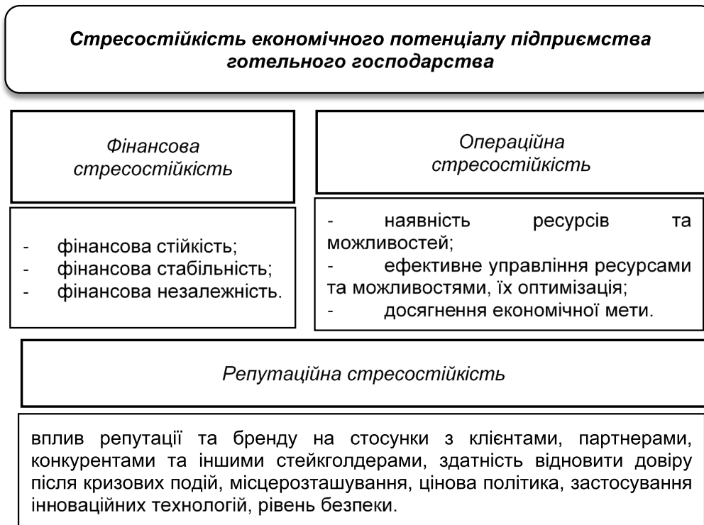
Рис. 2. Структура стресостійкості економічного потенціалу підприємства готельного господарства