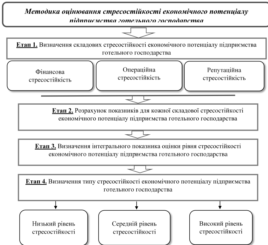
Рис. 3. Методика оцінювання стресостійкості економічного потенціалу готельного підприємства

- високий (0,671; 1 або +\infty ) – високий рівень рентабельності, можливість створення запасів підприємства для подальшого реінвестування та впровадження інновацій, встановлений чіткий порядок в організаційній системі управлінні, встановлені місія та цілі діяльності закладу, високий рівень іміджу закладу на макrorівні, займає високу частку на ринку.