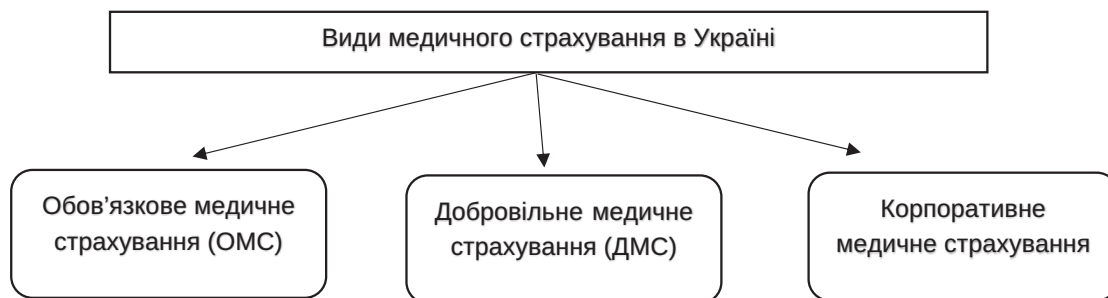
Рис. 1. Види медичного страхування в Україні [1, с. 9]

Воно може бути подібним до ДМС, але покриття та умови можуть відрізнятися.