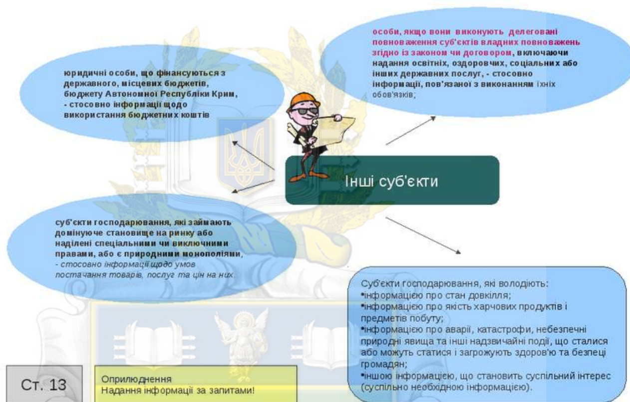
Рисунок 1.1 – Розпорядники публічної інформації