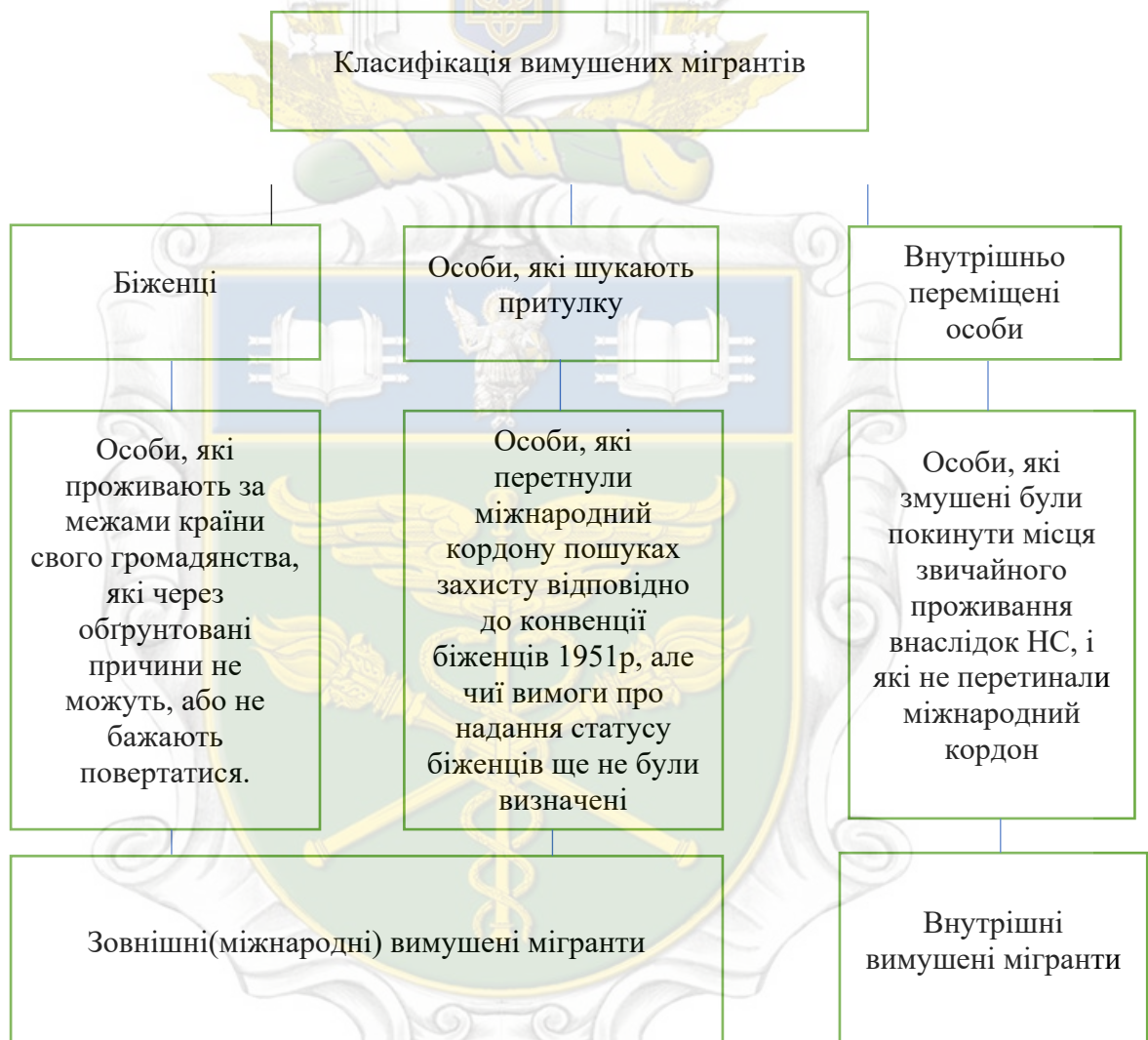
Рисунок 1.1 - Класифікація вимушених мігрантів

(IASFM) тлумачить поняття вимушеного мігранта як «переміщення біженців і внутрішньо переміщених осіб (осіб, переміщених в результаті конфліктів), а також людей, переміщених в результаті стихійних або екологічних лих, хімічних або ядерних катастроф, голоду або проектів у галузі розвитку» [36]. Міжнародна організація з міграції серед вимушених мігрантів виділяє внутрішньо переміщених осіб (внутрішні вимушені мігранти), біженців та осіб, які шукають притулку (зовнішні або міжнародні мігранти) (рис 1.1).