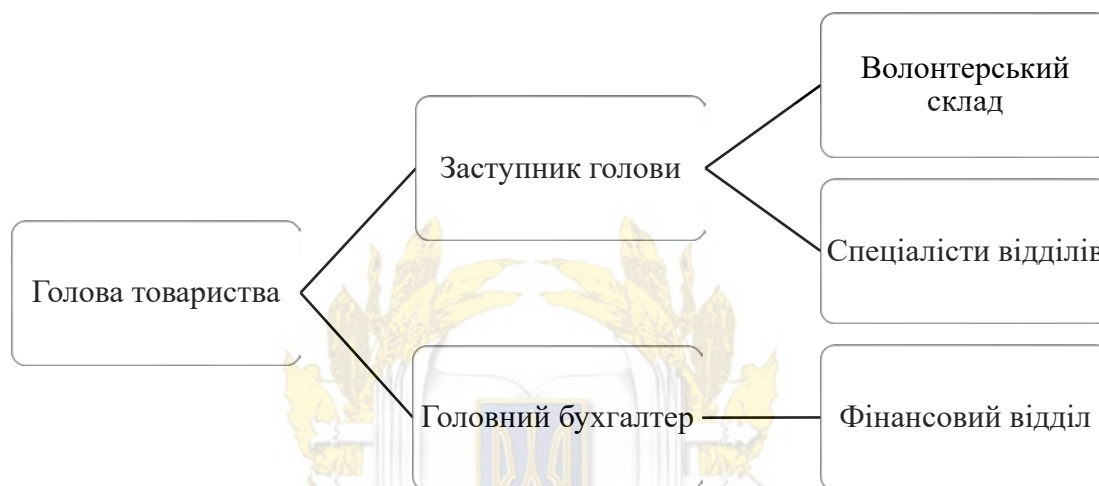
Рисунок 2.1 – Організаційна структура Вінницької Обласної Організації Товариства Червоного Хреста України