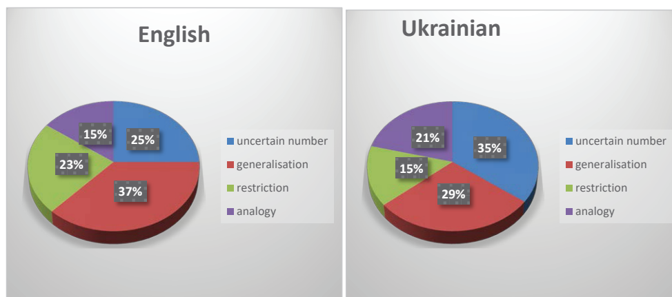
Fig. 2. Techniques of approximation tactic of linguistic hedging in English and Ukrainian academic discourse

Based on our observations, generalisation is the most common method of actualising the approximation tactic in English academic discourse, accounting for 37% of language samples. In contrast, the most common method in Ukrainian discourse is the use of the uncertain number technique, which accounts for 37% of the language samples. The use of analogy is equally common in both English and Ukrainian