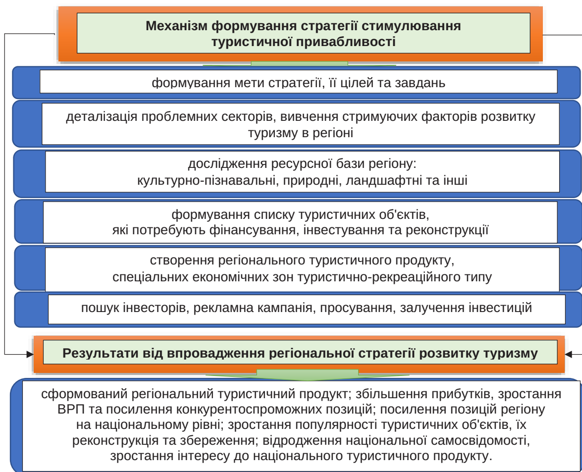
Рис. 1. Механізм формування регіональної стратегії розвитку туризму та її результативність

Слід зазначити, що знаннями необхідно ділитися між регіональними зацікавленими сторонами, оскільки занадто часто партнерські відносини зазнають невдачі через недостатнє розуміння бізнес-факторів один одного. Потужним механізмом