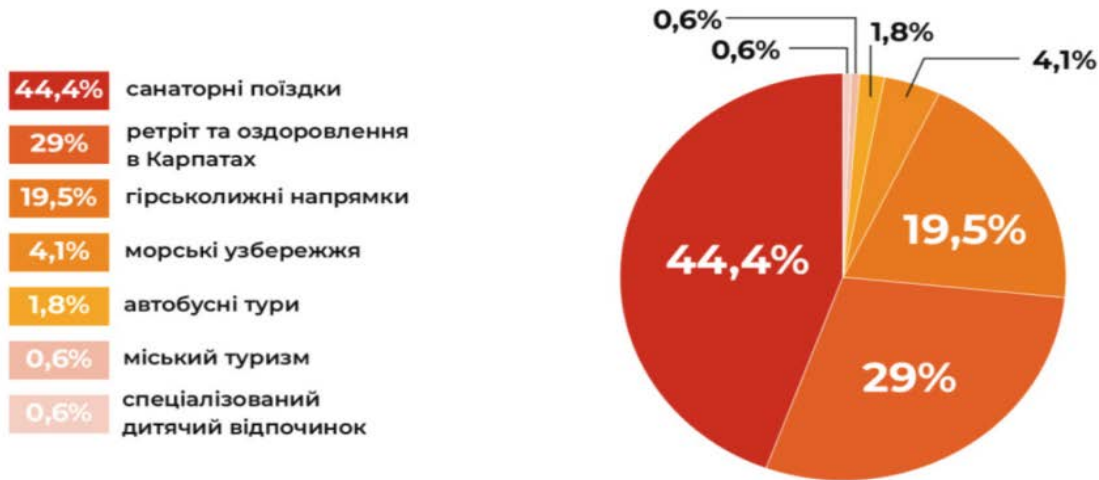
Рисунок 3 – Інфографіка Join Up (2022 рік) [8]

. До таких напрямів відновлення туризму в Україні з метою забезпечення гармонійного розвитку територій та враховуючи цілі сталого розвитку в контексті збереження природних ресурсів і довкілля, до заходів удосконалення державної політики України у сфері туризму доцільно віднести [2]: