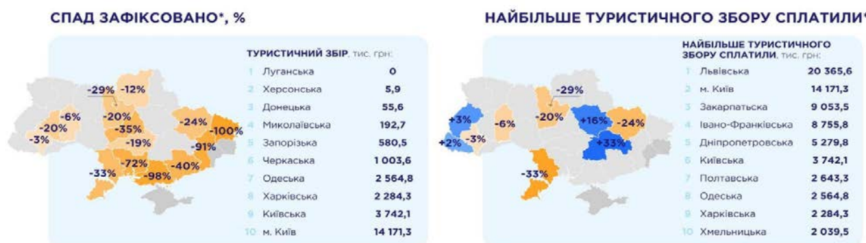
Рисунк 1 – Інфографіка туристичного збору в Україні за I півріччя 2023 року [3]

За той самий період у 2021 році – 665,420 млн грн. Водночас зменшилася частка сплаченого податку від діяльності туристичних баз та дитячих таборів відпочинку. Від цих засобів розміщення надійшло 60,428 млн грн податку проти 73,012 млн грн за перше півріччя минулого року. У 2021 році вони сплатили 178,921 млн грн [4].