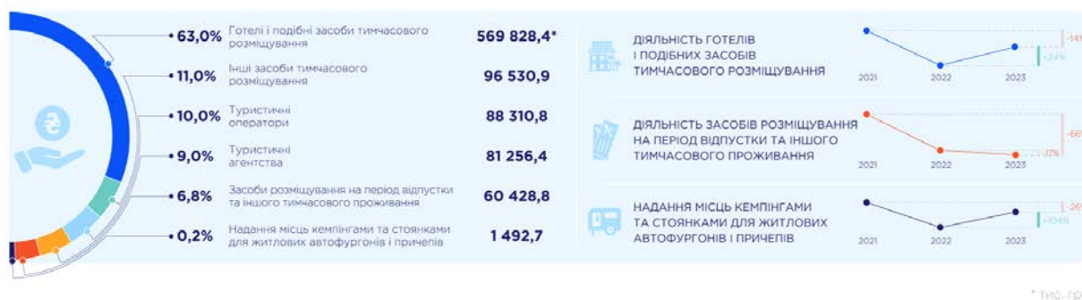
Рисунок 2 – Інфографіка ДАРТ щодо податків від туристичної галузі за 6 місяців 2023 року [4]

Багато компаній спеціалізуються на наданні туристичних послуг у безпечні райони України та сусідніх країн. Популярність внутрішнього туризму зросла, коли українці почали більше подорожувати в межах власної країни (переважно в західному напрямку України).