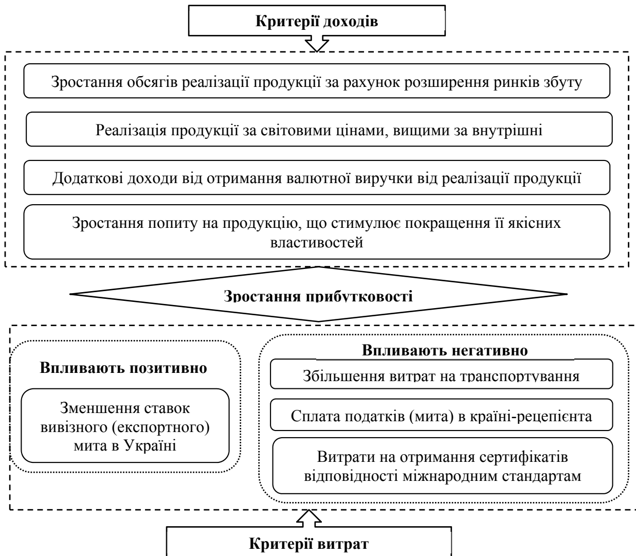
Рисунок 3 – Критерії залежності прибутковості підприємства від активізації міжнародної діяльності

вважаємо, що при виваженому та комплексному дослідженні зовнішнього ринку можливо досягти позитивних результатів діяльності на міжнародному ринку, певним чином нівелюючи витрати підприємства.