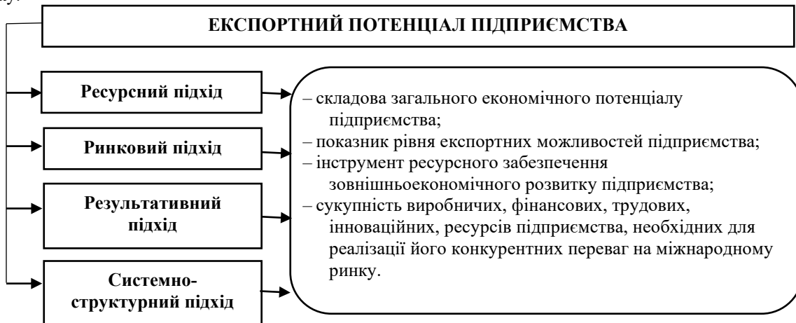
Рис. 2. Підходи до розуміння сутності поняття «експортний потенціал підприємства»

Беручи до уваги вище зазначені дефініції, ми вважаємо за доцільне консолідувати сутнісні характеристики понять «експортний потенціал» з точок зору різних підходів. Таким чином, ми вважаємо, що експортний потенціал – це складова загального економічного потенціалу підприємства, що забезпечує реалізацію його експортних можливостей використовуючи наявні виробничі, трудові, фінансові, інноваційні та інші види ресурсів, необхідних для формування конкурентних переваг підприємства на міжнародному ринку.