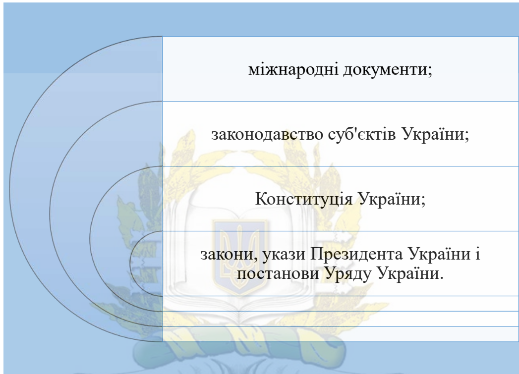
Рисунок 1.4 – Правова основа діяльності ЗМІ в Україні

Перша спроба законодавчого визначення поняття «свобода друку» була зроблена в першій статті Закону СРСР «Про пресу та інші засоби масової інформації» від 12 червня 1990 року. У ньому було зафіксовано, що «Друк і інші засоби масової інформації є вільними».