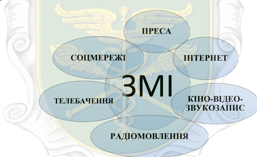
Рисунок 1.1 – Основні види сучасних ЗМІ

До ЗМІ відносять друковані видання, радіомовлення, телебачення, кіно, відео-, звукозаписи, а в останні десятиліття – ще й мережу «Інтернет» (рис.1.1). В мережі «Інтернет» розміщують сотні різних газет, радіо- і телевізійних каналів, які отримали, таким чином, фактично необмежений доступ до глобальної аудиторії [16].