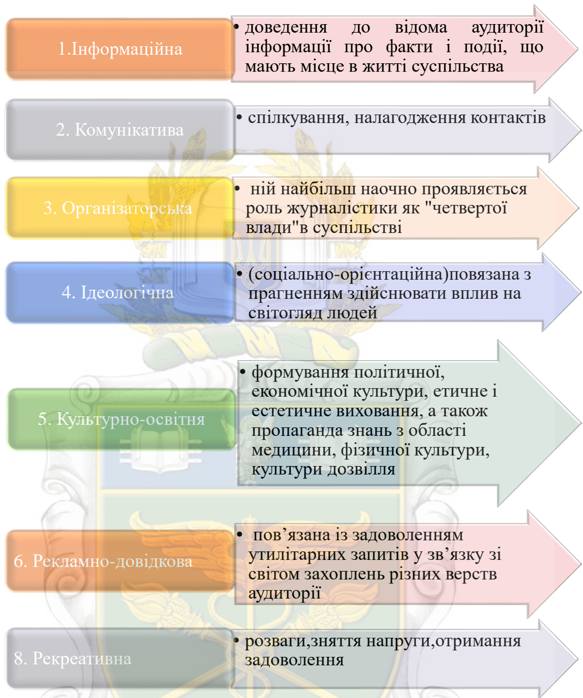
Рисунок 1.3 – Функції ЗМІ

Інформаційна функція є головною в діяльності ЗМІ та полягає вона в зборі, обробці та розповсюдженні важливих для громадян, організацій і органів державного управління, відомостей про те, що відбуваються події, явища і процеси. Без такого роду повідомлень неможливе жодне суспільство, незалежно від того, на якому історичному етапі свого розвитку воно знаходиться. У традиційних суспільствах цю функцію виконували, головним чином, гінці, кур'єри і посланці. Багато невеликих по території держав і міст використовували