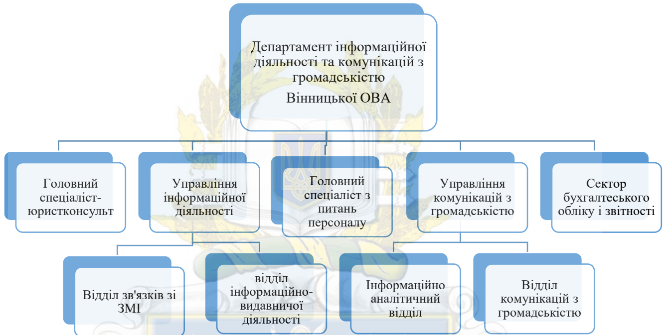
Рисунок.2.1 – Організаційна структура Департаменту інформаційної діяльності та комунікації з громадськістю Вінницької ОВА

громадськістю з питань реалізації державної політики, співпраця з громадськими організаціями та політичними партіями.