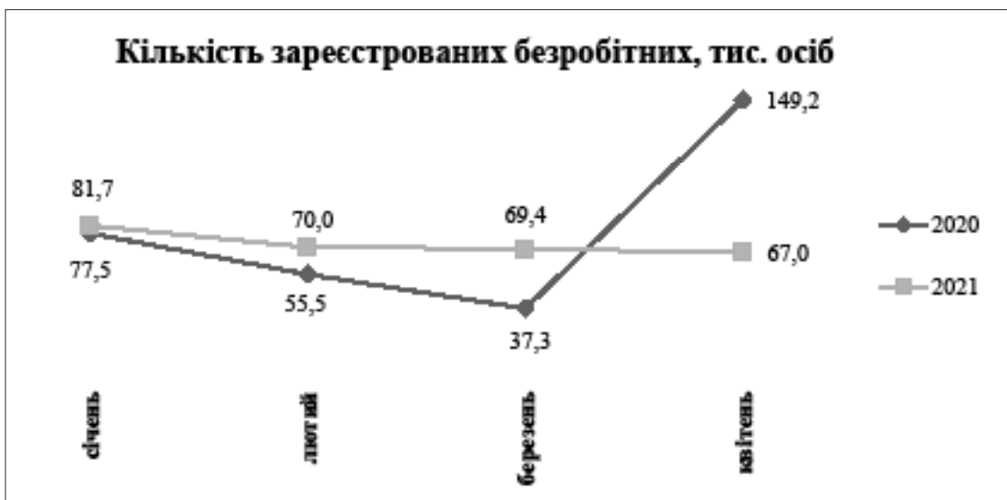
Рис. 1. Кількість зареєстрованих безробітних, тис. осіб [8]

Отже, для успішного використання трудових ресурсів випускників закладів вищої освіти перш за все в системі освіти необхідно звернути увагу на пропозиції, які вже існують на ринку праці, та встановити взаємозв'язок між органами освіти та державною службою зайнятості. Найголовніше – це підтримка розвитку не лише освітніх установ, але й орієнтація на попит. Саме тому наразі має постати питання про створення нових робочих місць та модернізацію вже існуючих. Це можна пояснити тим, що населення з високою формальною