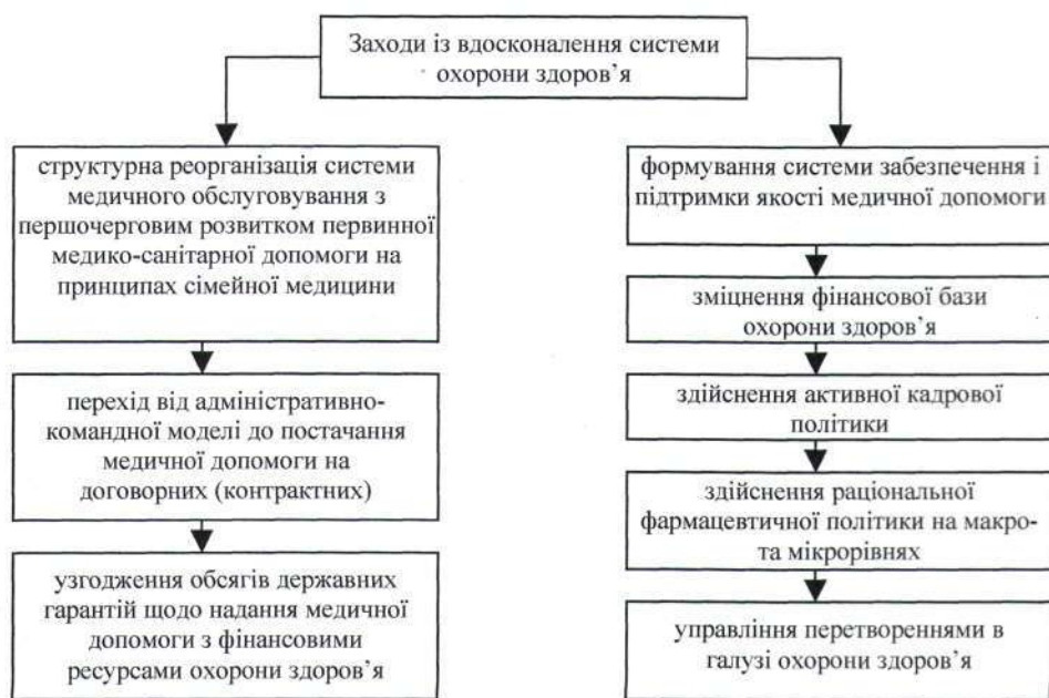
Рис. 3. Заходи із покращення функціонування системи охорони здоров'я в Україні