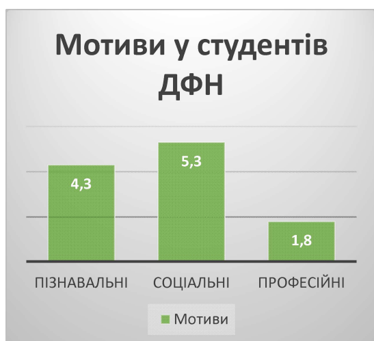
Рис 3. Структура мотивів навчальної діяльності студентів державної форми навчання

Отримані результати показали, що високі показники для студентів державної форми навчання (вибрали більш, ніж 60 % респондентів) мають такі мотиви навчальної діяльності, як: стати висококваліфікованим фахівцем (100 %); забезпечити успішність майбутньої професійної діяльності (90 %); отримати диплом (90 %). Установлено, що середньо значимими (вибрали 40 %-60 % респондентів) для студентів, є мотиви: набуті глибокі та міцні знання (36 %); постійно отримувати стипендію (38 %); одержати інтелектуальне задоволення (36 %) (рис. 3).