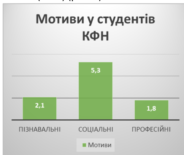
Рис 4. Структура мотивів навчальної діяльності студентів контрактної форми навчання

Низькі значення (вибрали менш ніж 40 % респондентів) у студентів мають мотиви: не запускати вивчення предметів навчального циклу (20 %),