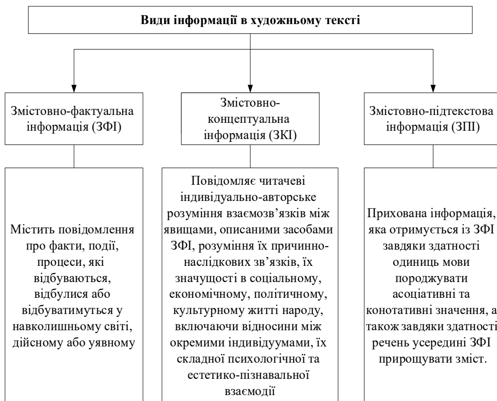
Рис. 1. Види інформації в художньому тексті

Змістовно-концептуальна інформація повідомляє читачеві індивідуально-авторське розуміння взаємозв'язків між явищами, описаними засобами змістовно-фактуальної інформації, розуміння їх причинно-наслідкових зв'язків, їх значущості в соціальному, економічному, політичному, культурному житті народу, включаючи відносини між окремими індивідуумами, їх складної психологічної та естетико-пізнавальної взаємодії