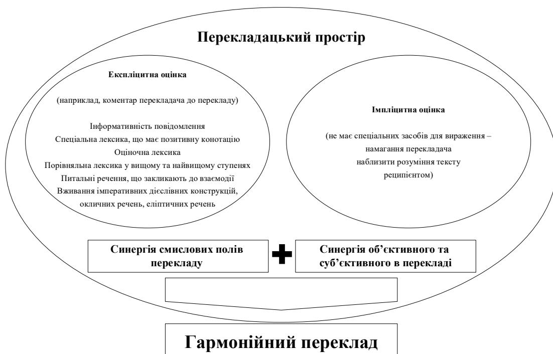
Рис. 3. Структурне відображення складових гармонійного перекладу