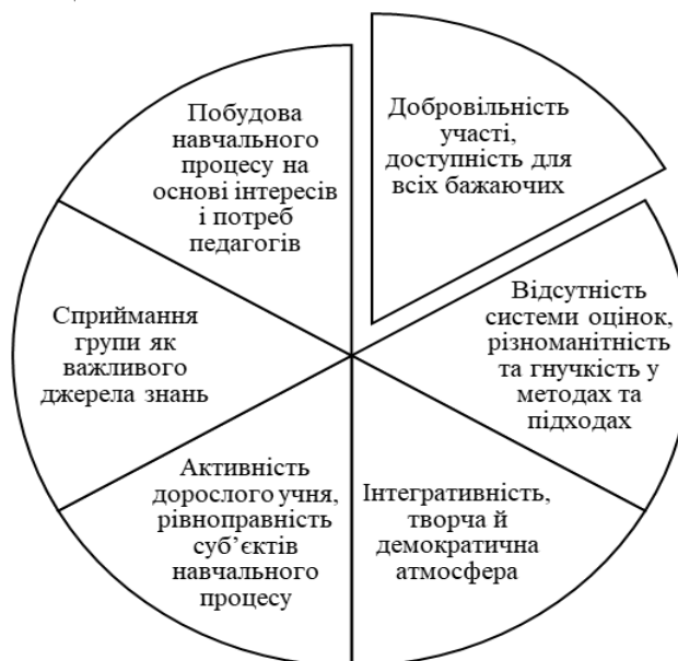
Рис. 1. Основні ознаки неформальної освіти

Сектор неформальної громадянської освіти дуже різноманітний (рис. 1): щотижневий дискусійний клуб, акція, яка звертає увагу населення на соціальні проблеми, соціальні проекти, різноманітні платформи для тренування громадянської активності, та дає можливість здобувати величезний досвід соціальної взаємодії в команді, з партнерами, з оточенням, сприяє розвитку таких умінь і якостей, як робота в команді, тайм-менеджмент, вміння боротися зі стресом, розв'язувати конфлікти, домовлятися, тобто це можливість розвитку соціальних компетенцій.