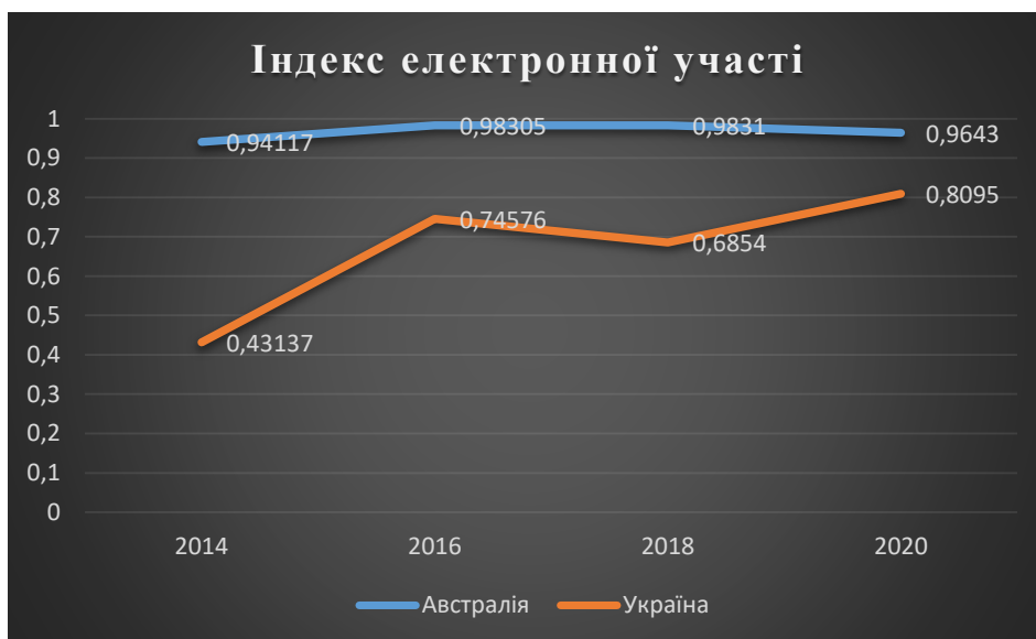
Рисунок 3 - Динаміка значення індексу EPI Австралії та України за

В доповнення до EGDI - Індекс електронної участі EPI (E-Participation Index) допомагає краще побачити ситуацію не тільки із практичним застосуванням, а й з вмінням влади надати умови для розвитку цифрового урядування своєї держави [3]. Для цього ми розглянемо діаграму зі значенням індексів Австралії та України (рис. 3).