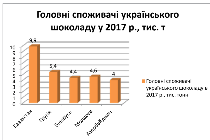
Рис. 2. Головні споживачі українського шоколаду протягом 2017 р.