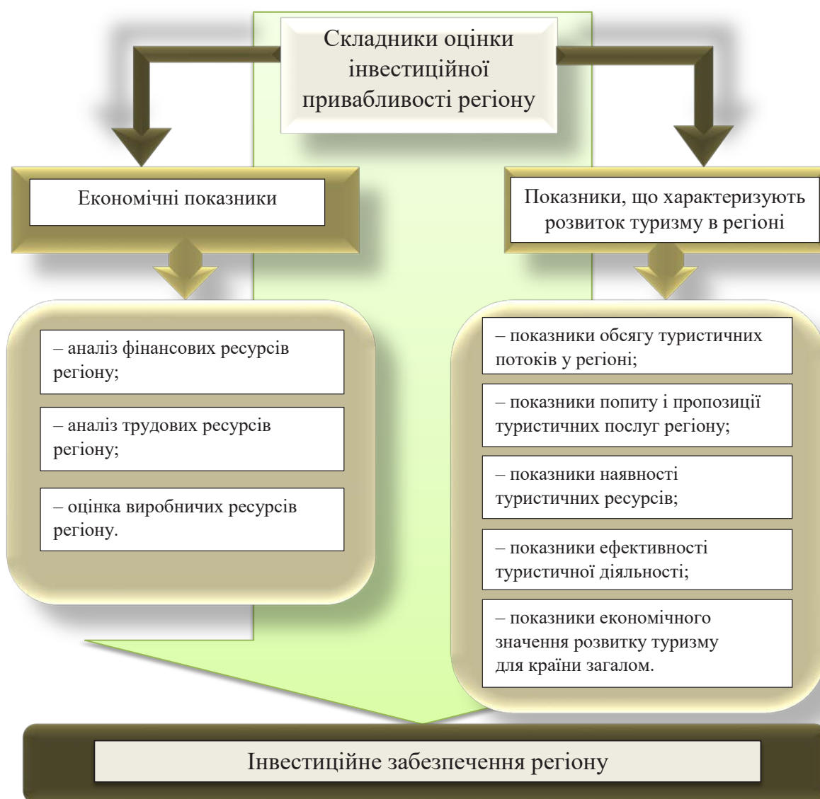
Рис. 3. Схема показників, необхідних для оцінки інвестиційної привабливості та забезпечення регіону