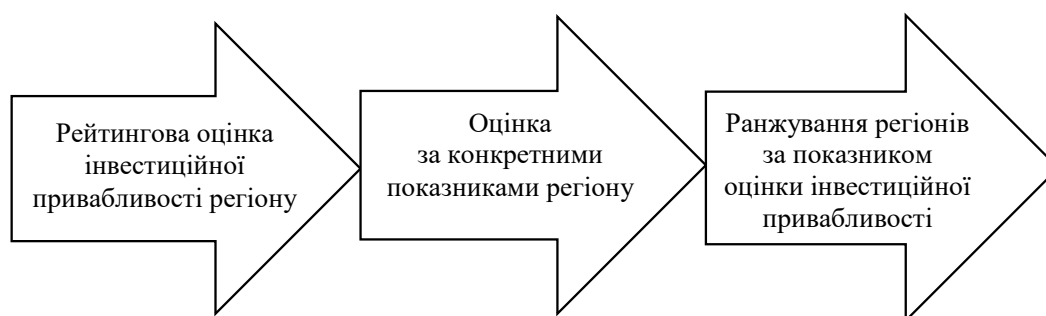
Рис. 1. Схема етапів проведення ранжування регіонів за показником інвестиційної привабливості

1) обґрунтування вибору системи показників для рейтингової оцінки;