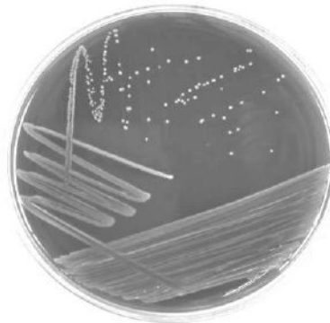
Рис. 5. Фото мікрофлори стравоходу і кишкового тракту