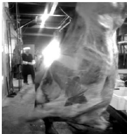
Рис. 1. Фото огляду туші на небезпечні фактори

Питання 1. Чи можливо, що сировина буде містити досліджуваний небезпечний фактор на недопустимому рівні? Відповідаючи на це питання, слід врахувати, наприклад, точку епідеміологічної інформації показників діяльності постачальника м'яса по точках безпеки загального огляду туші: гематоми, пухлини, зміни кольору, механічні ушкодження продукту (рисунк 1). Якщо відповідь буде негативною, то сировину не слід розглядати в якості критичної контрольної точки. Якщо такої впевненість відсутня, то слід перейти до питання 2.