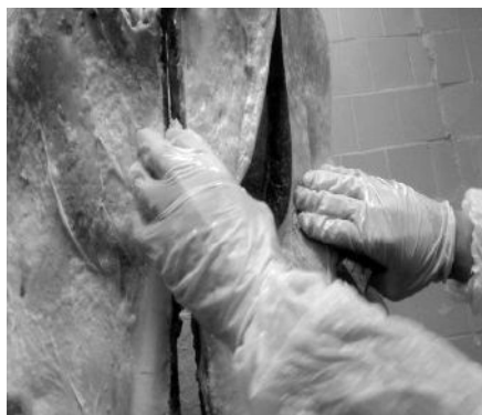
Рис. 3. Фото контрольнього огляду туші

Питання 3. Чи існують небезпечні фактори перехресного забруднення для продуктів, які не будуть контролюватися? Якщо відповідь на питання 3 «так», то якість сировини є критичною. Якщо відповідь негативна, то якість сировини не є критичною, і експерти переходять до аналізу наступного етапу контролю (точка безпеки – контрольний розріз туші на абсцеси та гематоми і механічні пошкодження) (рисунки 3,4). Результати досліджень також необхідно зафіксувати в спеціальній таблиці аналізу небезпечних чинників.