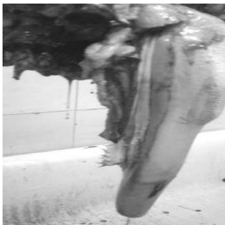
Рис. 2. Фото огляду язика на мікози

Припускаючи, що небезпечний фактор присутній в сировині, необхідно послідовно вивчити виробничий процес з використанням технологічної схеми і обстежити виробничу лінію для того, щоб встановити, чи усуне даний небезпечний фактор або знизить його до безпечного рівня. Якщо відповідь на це питання буде позитивною, то можна перейти до питання 3. Якщо відповідь негативна, то якість сировини є критичною.