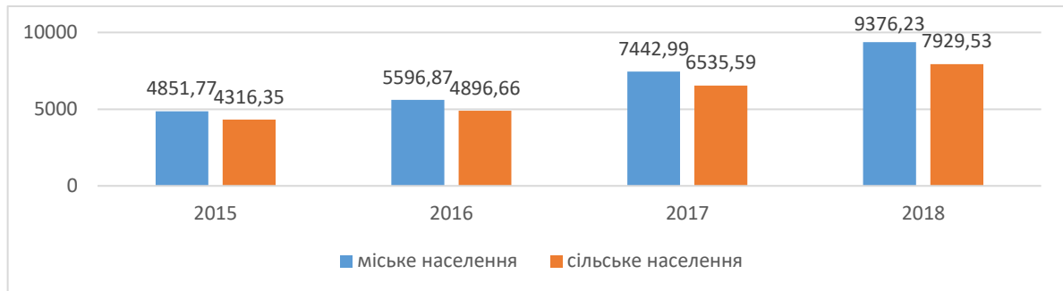
Рисунок 1 – Середньомісячні сукупні доходи населення України, тис. грн. [1]

З'ясувавши, чим керуються ті, хто їде відпочивати у село, проаналізуємо, що рухає тими, хто на них там радо чекає. Перш за все, безсумнівно, йдеться про прагнення сільських жителів у такий спосіб отримати додатковий дохід. Як свідчить статистика, доходи жителів села традиційно є нижчими, порівняно з доходами містян (Рис. 1-2), і надання мандрівникам тих чи інших туристичних послуг спроможне суттєво поповнити бюджет сільських домогосподарств.