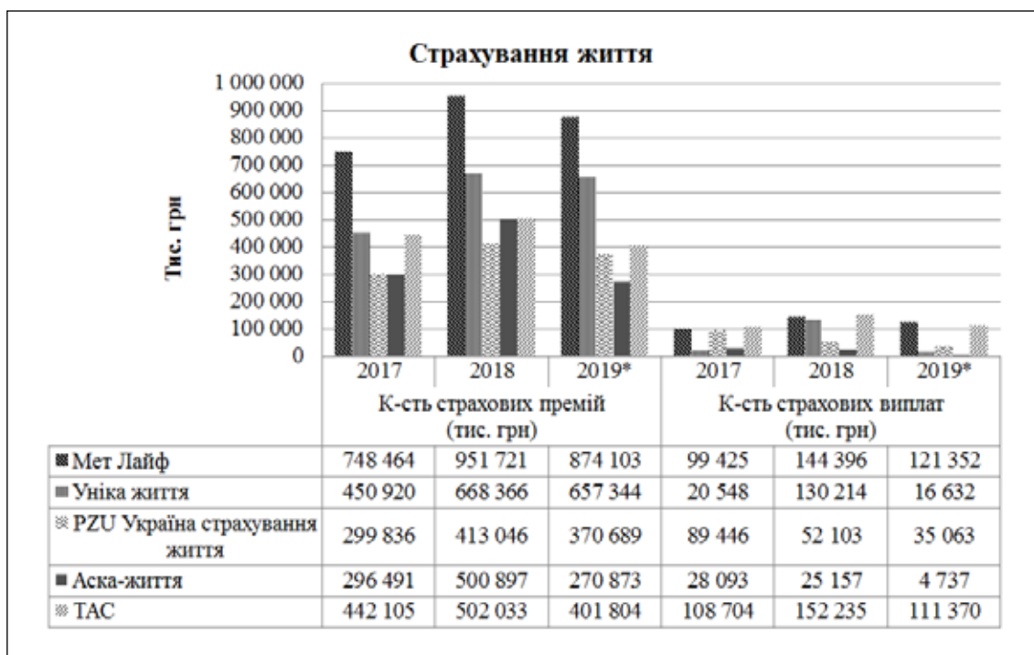
Рис. 2. Сума страхових премій та відрахувань лідерів страхових компаній в Україні зі страхування життя

Повноцінний перехід до системи медичного страхування дасть змогу забезпечити рівність