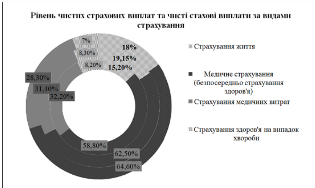
Рис. 3. Рівень страхових виплат за видами страхування за 2016–2018 рр.