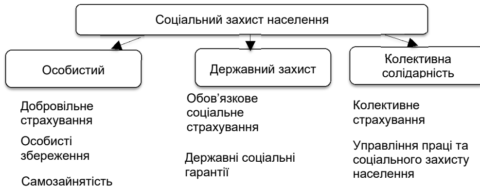
Рис. 2. Система фінансового забезпечення соціального захисту населення