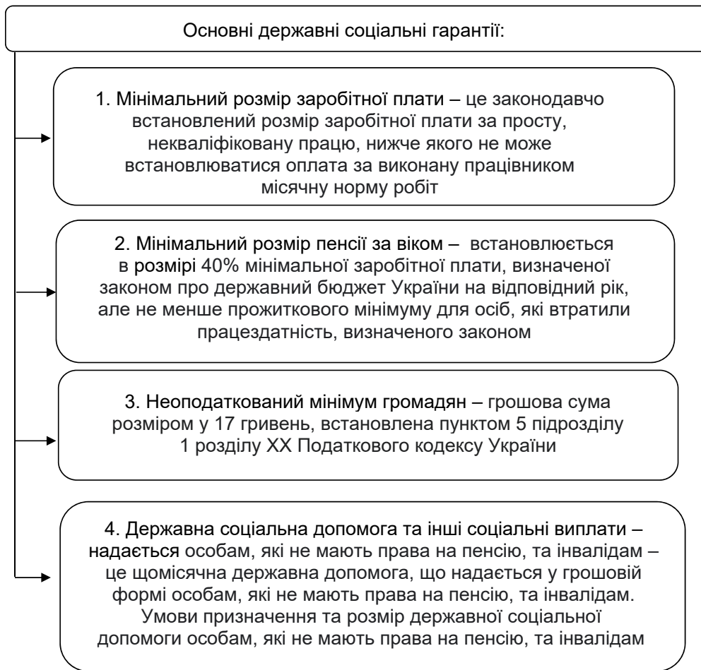
Рис. 1. Основні державні соціальні гарантії в Україні