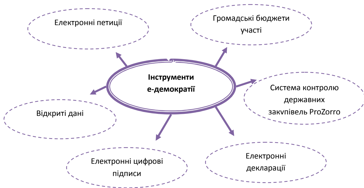
Рис. 1. Інструменти Е-демократії

Розглянемо докладніше інструменти електронної демократії (рисунок 1).