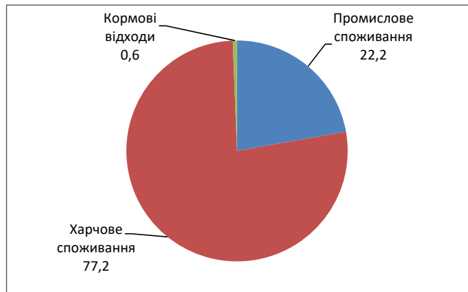
Рис. 2. Структура глобального споживання харчових рослинних олій (квітень 2017/2018 МР), %

Прогноз FAO відносно обсягів світового виробництва продукції олійних культур у 2017/18 МР у порівнянні з попередніми сезонами є достатньо помірним та базується на очікуваннях експертів щодо світового попиту на сировину. Фактичні дані, звичайно, можуть бути скориговані із потенційним зростанням доходів населення та підвищенням по-