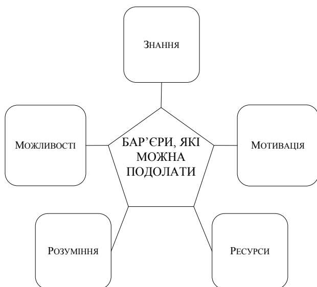
Рис. 3. Бар'єри, на подолання яких спрямована дорадча діяльність