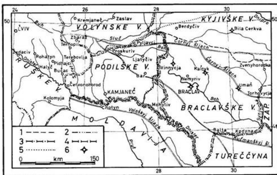
Рис. 1. Геостратегічне положення Поділля у XVI-XVII ст. За [5].

– групи історико-політичних чинників . У цю групу чинників входять розвиток Поділля у межах тієї чи іншої держави, його адміністративний статус і структура, зміна кордонів та належність до них, кількість та характер війн, а також інші історичні процеси. У цьому відношенні Поділля унікальний регіон. Упродовж століть воно було частиною своєрідного фронтиру між західно-європейською і східною-азіатською цивілізаціями. Крім цього, Поділля входило до складу багатьох держав – Київської Русі, Литви, Польщі, Туреччини, Росії (рис. 1). Окремі його райони тривалий час були прикордонними і зазнавали