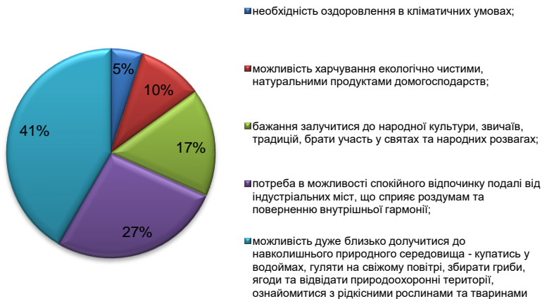
Рис. 3. Кількісне співвідношення мотивів відпочинку в екологічній місцевості

Дослідження показало, що значна частка (41 %) тих, хто відпочиває в природній місцевості, надає перевагу такому виду відпочинку завдяки можливості дуже близько долучитися до навколишнього природного середовища – купатись у водоймах, гуляти на свіжому повітрі, збирати ягоди, гриби та відвідати природоохоронні території, ознайомитися з рідкісними рослинами та тваринами. Також значну частку населення (27%) мотивує до екотуризму потреба в можливості спокійного відпочинку подалі від індустріальних міст, що сприяє роздумам та поверненню внутрішньої гармонії.